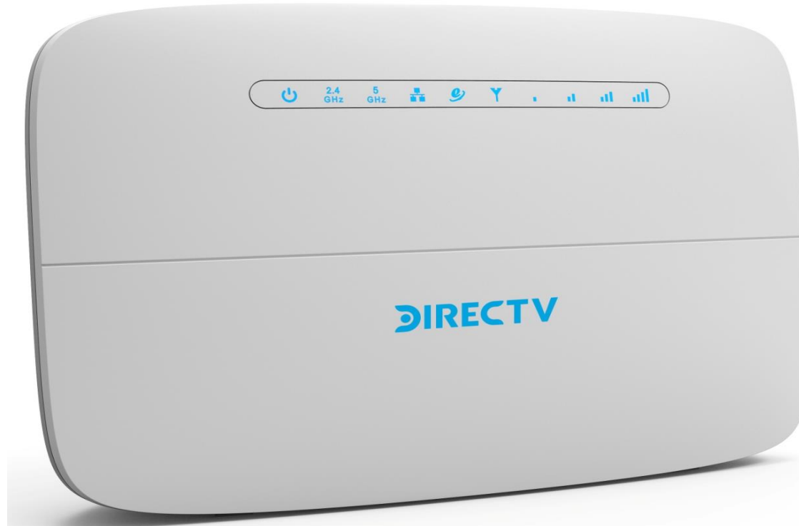
Imagen CPE Gemtek WLTFGT-152ACN LTE